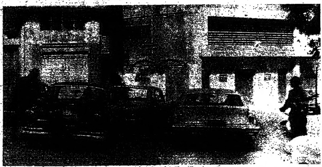
■ حائل اقامة الجيش في المنطقة التجارية ■